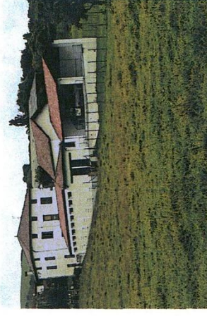
Bourg - Plaza 64640 Saint-Esteben / Donoztirig