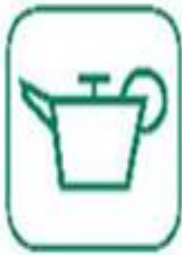
HUILES DE VIDANGE