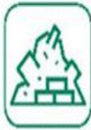
BRANDS / INERTES