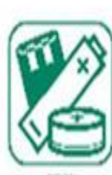
PILES ET ACCUMULATEURS