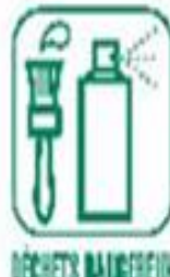
DÉCHETS BANDELIÈRE DES MÉNAGERS