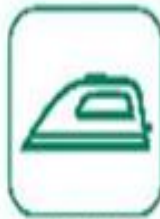
PETITS APPAREILS MÉNAGERS