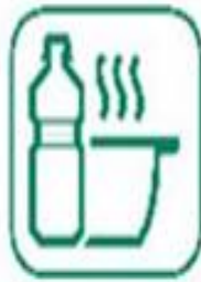
HUILES DE FRITURE