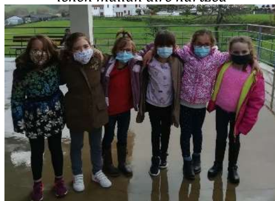
tous masqués ! denak maskaturik !