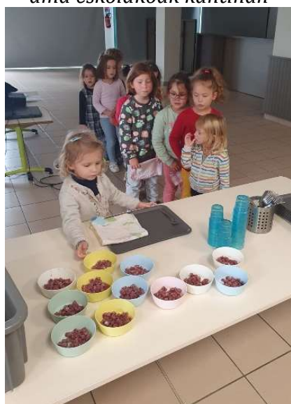
le self, comme des grands ! self-a, handiak bezala !