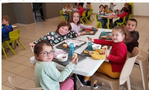
les maternelles à la cantine ama eskolakoak kantuan

Les effectifs prévisionnels pour l'année prochaine 2021-2022 sont stables.