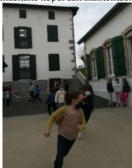
la récréation en primaire lehen mailan aire hartzea

2021-2022 heldu den ikasturteko aurreikusitako kopuruak mantentzen dira.